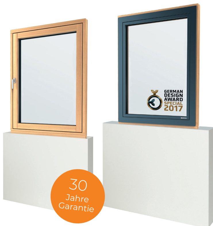
Holz-Alu INLINE 91 SLIM